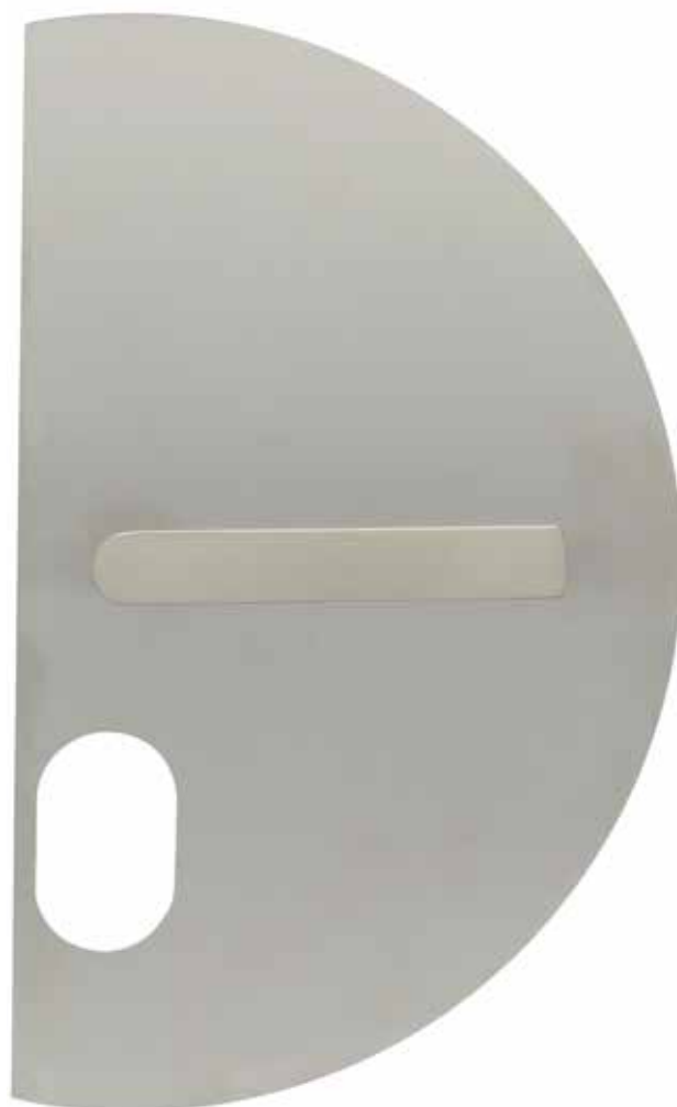
PLAQUES DEMI LUNE avec béquilles. Percement cylindrique et A2P2** Modèles présentés en inox